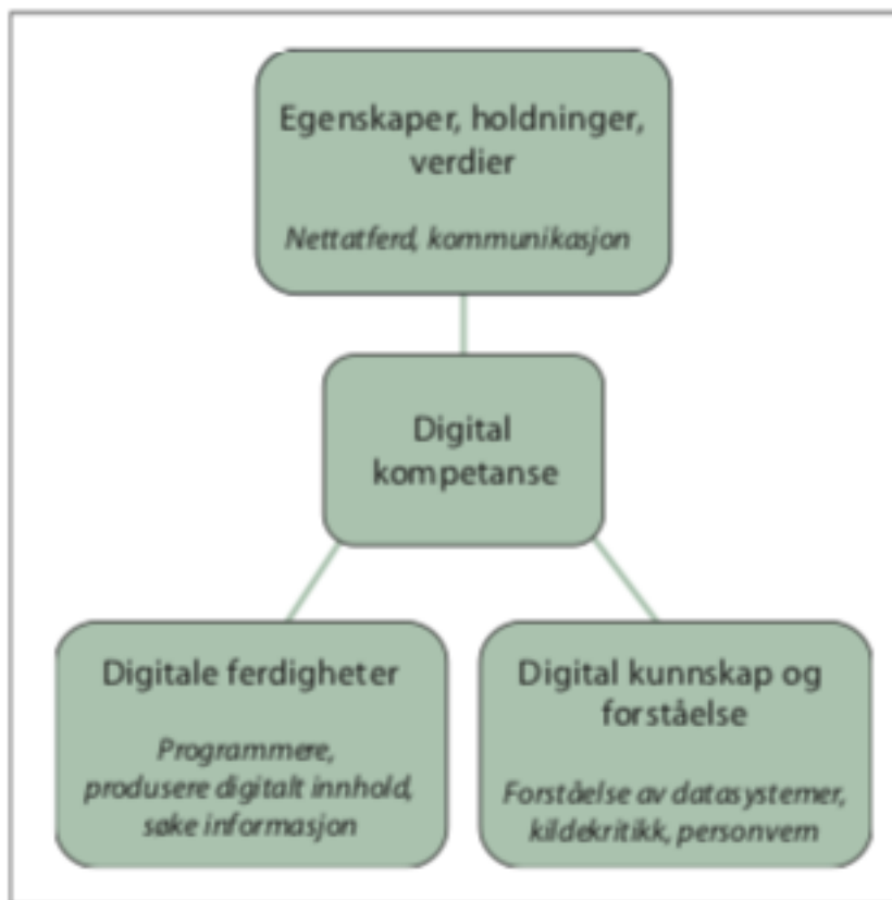
Figur 2.10 Digital kompetanse

DigComp definerer digital kompetanse på følgende: «å være bevisst, kritisk og kreativ bruk av IKT til å oppnå mål relatert til arbeid, ansettbarhet, læring, fritid, inkludering og/eller deltakelse i samfunnet» (Regjeringen, 2019, s. 22). EU spesifiserer sin definisjon nærmere med fem områder som inneholder informasjonsbehandling, kommunikasjon, innholdsproduksjon, sikkerhet og problemløsning (Regjeringen, 2019, s. 22).